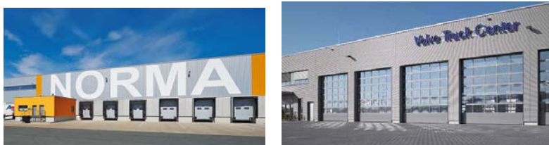
Fot. 1 i 2

Bramy przemysłowe z płytą o grubości 67 mm i przegrodą termiczną nadają się szczególnie do zastosowania w logistyce świeżych i mrożonych produktów, a także jako energooszczędne zamknięcia do obiektów przemysłowych i użytkowych.