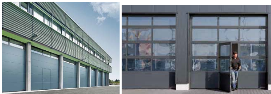
Fot. 6 i 7

Nowe bramy przemysłowe Hörmann są wyposażone w ocieplane drzwi przejściowe bez wystającego progu.