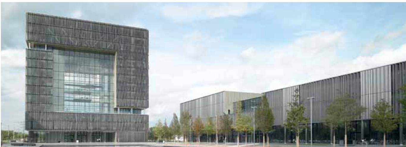
Siedziba ThyssenKrupp w Essen wyposażona w produkty firmy Hörmann z certyfikatem DGNB Gold