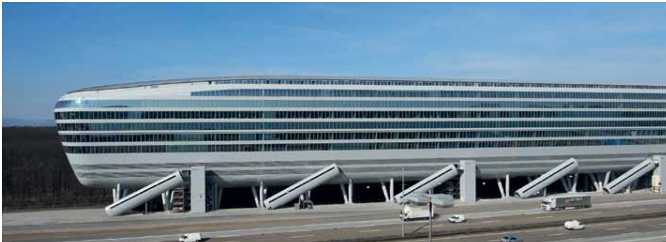
The Square we Frankfurt nad Menem wyposażony w produkty firmy Hörmann z certyfikatem Leed Gold