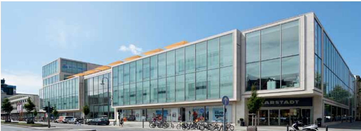
Boulevard Berlin wyposażony w produkty firmy Hörmann z certyfikatem breeam